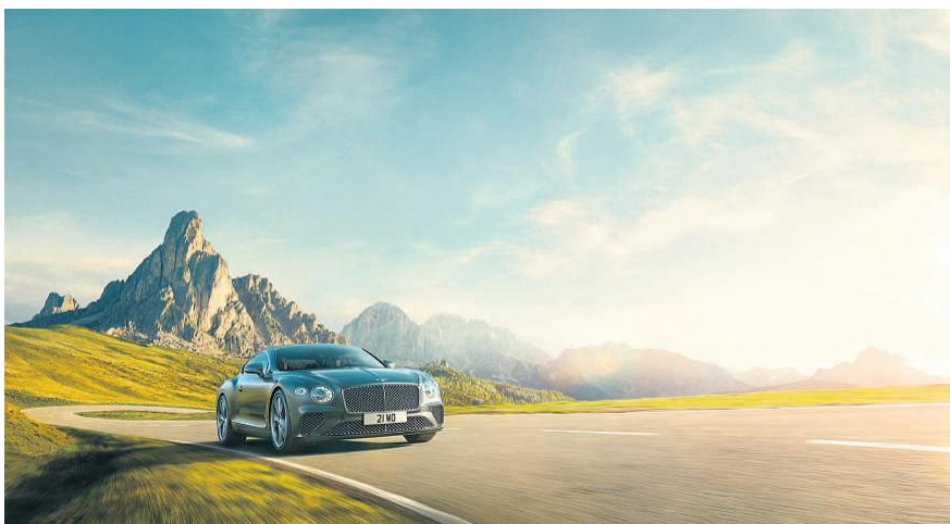
Den nye Bentley kan nu købes med B&O-lyd i kabinen.

I forvejen samarbejder B&O med Harman om lydssystemer til udvalgte bilmodeller fra Audi,