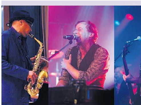
Moonjam spiller i Struer på fredag aften.