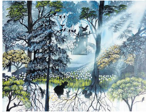
Et motiv som dette kan ses på udstillingen.