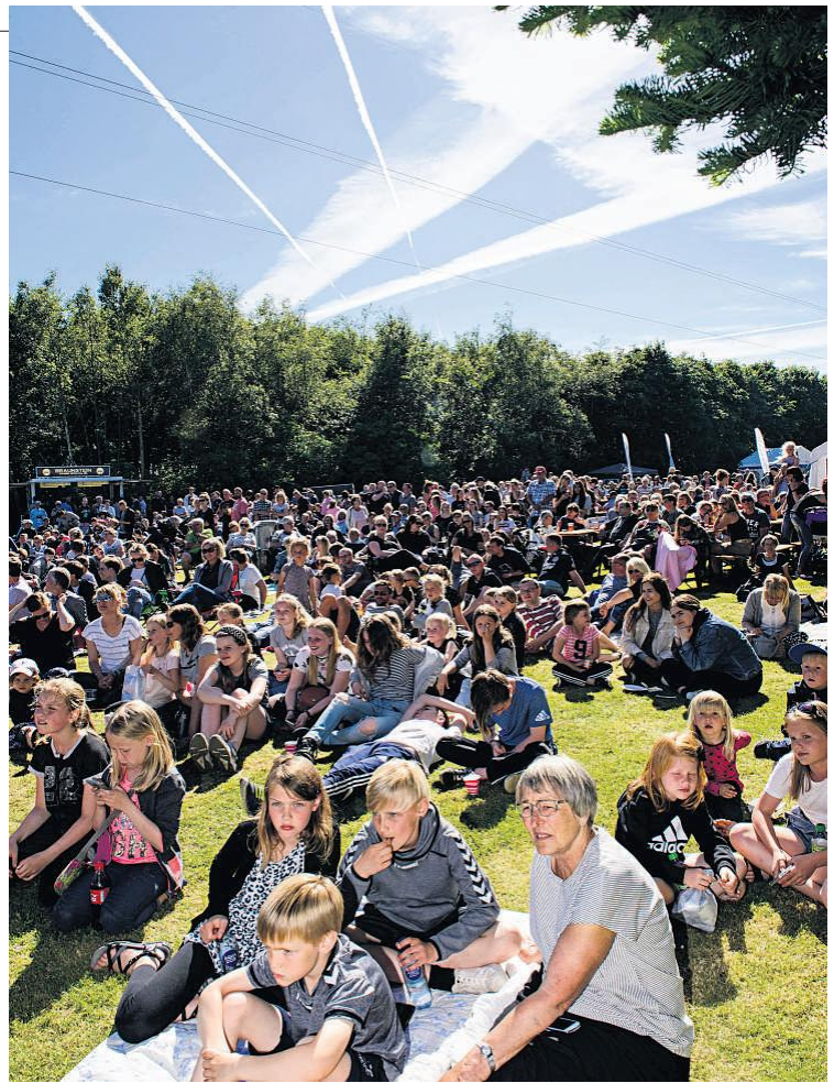
Der var til tider tæt pakket i Byskoven, og der kom ikke færre mod aften.

- Så er det klart nok, at man allerede overvejer næste skridt, men det er der altså ikke et klokkeklart svar på, siger Bent Hargaard.