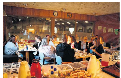
Der var fyldt i Rytterstuen til arrangementet i Thyholm Rideklub.

Hun havde to heste i hallen, hvor hun viste og fortalte om ting, man skulle være særlige opmærksomme på. Hun viste også, hvordan hun arbejder, når hun afbalancerer en hest, og om hvad hun særlig lægger vægt på. En rigtig hyggelig aften.